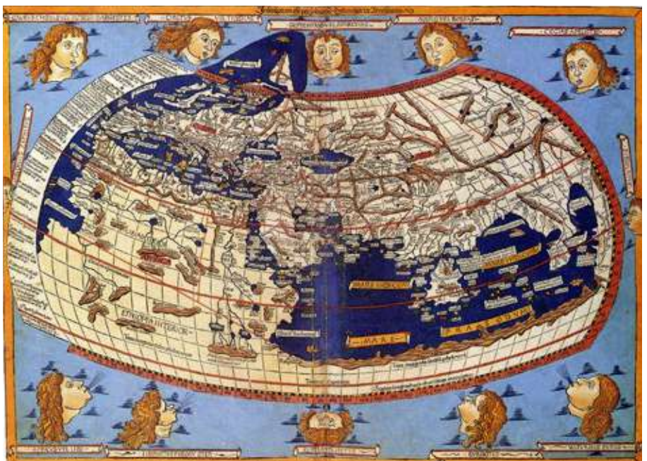
Figura 7 - Harta lumii după Ptolemeu, secolul al II-lea, ediția Nicolaus Germanus, 1467