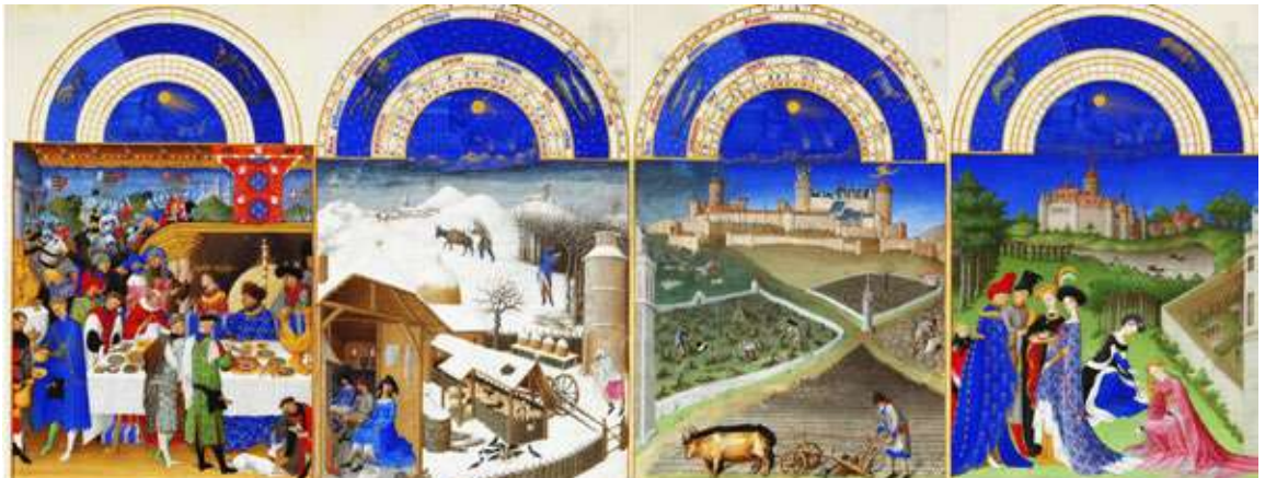
Figura 3 - Calendar cu scene din domeniul feudal