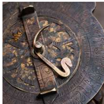
Figura 3 - Astrolab