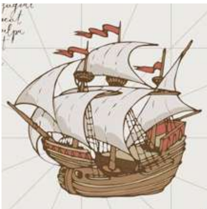
Figura 6 - Caravelă

În secolul al XV-lea, concepția geografului grec Ptolemeu privind forma sferică a Pământului revine în actualitate, prin intermediul unor învățați precum Paolo Toscanelli. În acest context dorința de cunoaștere și progres, dar și necesități de natură comercială, determină statele puternice ale Europei să finanțeze explorările geografice.