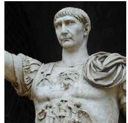
Figura 2 - Împăratul Traian (98-117 d. Hr.)

V. Scrie un text de 80-100 de cuvinte în care să prezinți Societatea medievală, pornind de la sursele de mai jos: