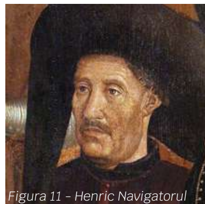
Figura 11 - Henric Navigatorul