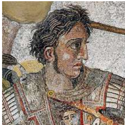
Figura 1 - Alexandru Macedon (336-323 î. Hr.)

IV. Descrie în 3-5 rânduri o acțiune politică și una culturală realizată de conducătorii din Figura 1 și Figura 2: