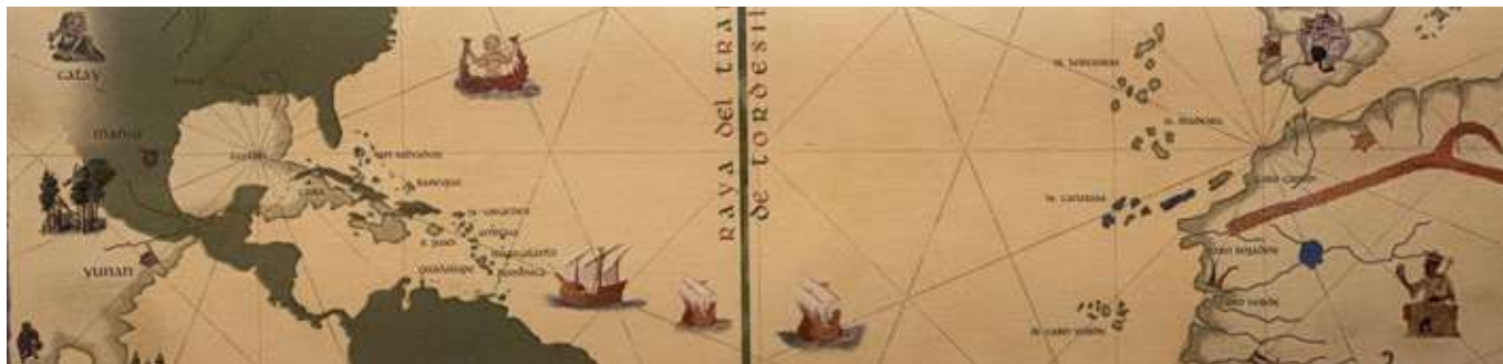
Figura 4 - Portulan