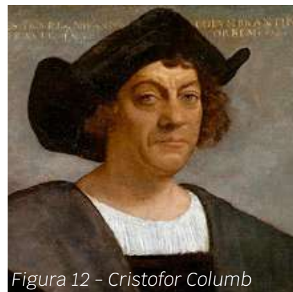
Figura 12 - Cristofor Columb