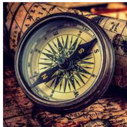
Figura 2 - Busolă

Portulanul (Figura 4), hărți ale țărmurilor, folosite în navigație în secolele XIII-XVI, cu informații despre istoria, geografia, situația politică și economică ale unei regiuni sau ale unui port.