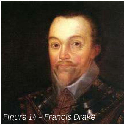
Figura 14 – Francis Drake

După cucerirea Noii Lumi, europenii vor trece la exploatarea resurselor umane și materiale. Băștinașii vor fi convertiți la catolicism, și vor adopta stilul de viață impus de conchistadori. Vor fi aduse și aclimatizate în Europa noi plante: porumbul, cartoful, tomatele, tutunul etc., dar și păsări: curcanul. Axa comercială a lumii se mută în Oceanul Atlantic, care va fi împânzit de nave comerciale care vor transporta mari cantități de aur, argint, produse exotice, dar și sclavi.