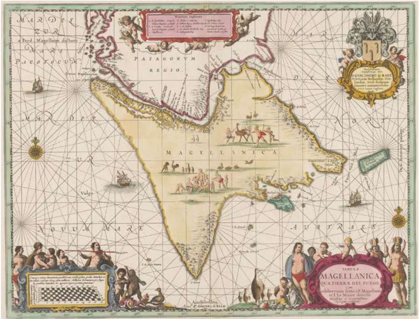
Figura 16 - Harta Țării de Foc și a Strâmtoării Magellan, Kaart van Vuurland

1 Precizează două descoperiri atribuite exploratorului Fernando Magellan. 🗺️