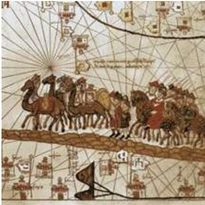
Figura 5 - Caravană de cămile alături de care călătorește Marco Polo