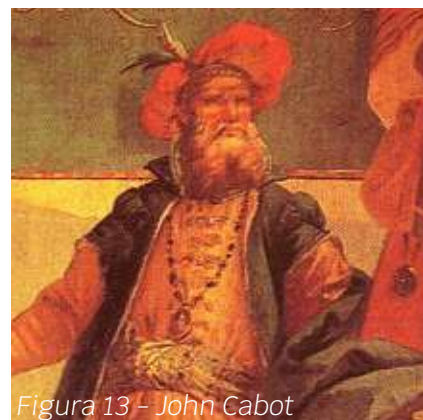
Figura 13 - John Cabot