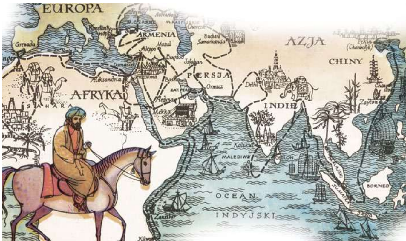
Figura 1 - Hartă reprezentând mijloace de călătorie