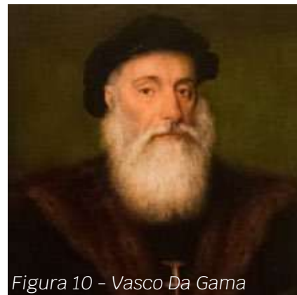
Figura 10 - Vasco Da Gama

Teritoriile descoperite au fost transformate în colonii de cuceritorii lor. Rivalitatea dintre Spania și Portugalia a determinat semnarea, în 1494, a Tratatului de la Tordesillas, care împărțea printr-o linie imaginară Oceanul Atlantic, și astfel, și posesiunile celor două state. Portughezii preluau partea de est, iar spaniolii partea de vest.